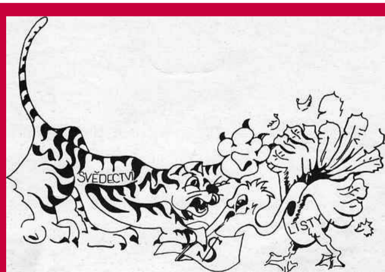
K neaktivnějším exilovým médiím patřily Listy Jiřího Pelikána. Vycházely nejen v češtině, ale také v italštině, francouzštině a dalších jazycích. Komunistická propaganda samozřejmě měla jasno: pro mrzký dolar od imperialistů udělá exil kokol.